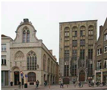
"Huis Ter Beurze" te Brugge.

De Italiaanse geschiedschrijver Lodovico Guicciardini beschreef hoe de naam van de koopmansbeurs te Brugge afgeleid was van de naam van de familie, via de gelijknamige herberg die gemeenzaam gebruikt werd om het plein aan te duiden ("Ter Beurze") dat het financiële hart van de stad vormde. De beurs van Brugge werd een begrip, en de internationale kooplieden namen de naam "beurs" mee terug naar hun land: eerst de Italianen (borsa), maar al snel ook de Fransen (bourse), de Duitsers (Börse), de Tsjechen (burza), de Zweden (börs), de Denen en Noren (børs). In de meeste talen valt het woord samen met dat voor geldbuidel, teruggaand op het Latijnse bursa (waarvan uiteraard ook de naam van de familie Van der Beurse is afgeleid). (Bron: Wikipedia.)